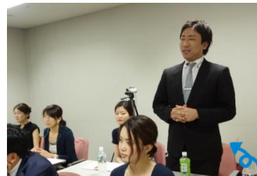
出口先生 開業に向けて着々と準備をすすめているそうです！

発表いただいた先輩方をはじめ、実行委員のみなさん毎日朝早くから夜遅くまで本当にお疲れ様でした！