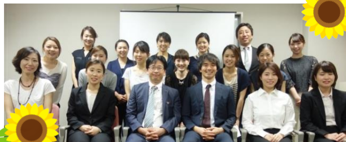
最後の集合写真です！みんなスマイルがいいですね♪