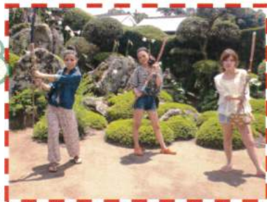
武家屋敷で 楽しい思い出♪

その後平川動物園へ。キリンや象などが本当に自然にいる様に飼育しており、大きな柵などもなかったの、すぐ間近でみることもできてよかったです。全部見るのに3時間くらいかかり、汗だくになりながら回りましたが、とてもいい思い出になりました。(笑)