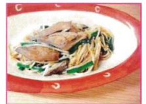
豚レバーともやしの炒め物