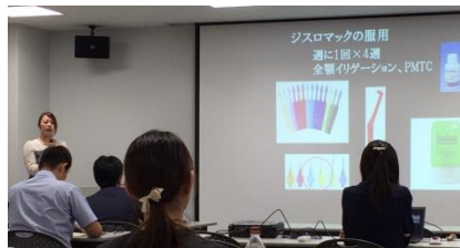
堂々と発表されてました！

各歯科医院から代表の方々の症例発表が行われました。歯周病の治療は、喫煙や生活背景を知ることの重要性や歯肉の改善により口腔内の審美の意識が高まり矯正治療へつながった症例の発表がありました。また、日々診療で感じる疑問について意見交換なども行われ、いろんな考え方を知れて 良い刺激 になりました。