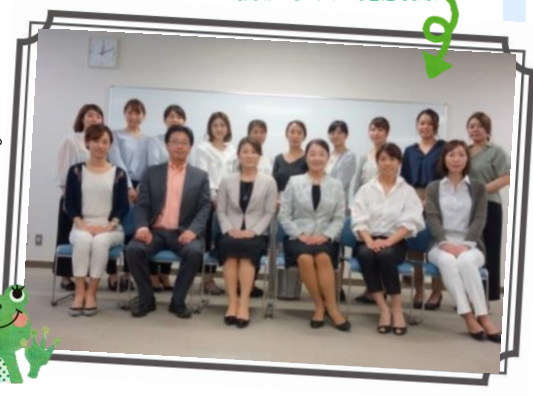
最後は全員で記念撮影

そういったことをDVDの中で問いかけられ、自分自身の自己基盤を振り返られるとても良い機会となりました。