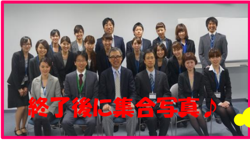
終了後に集合写真♪

歯周病・インプラントセンター (医) 怜生会 慶歯科医院 住 所：熊本市城山大塔1丁目9-25 T E L：(096)329-3920 E-mail：info@keishika.com HPアドレス：www.keishika.com/pc/