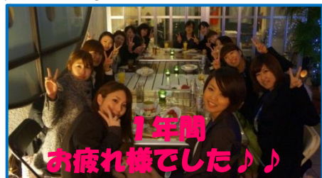
1年間 お疲れ様でした♪♪

『口腔内から普通の食事が食べれるか』、『口腔ケアが行き届いているか』、『むせがなく摂食・嚥下ができるか』などは、実際には患者様の健康回復、誤嚥性肺炎予防、そして食事を楽しみにできる点で重要だと感じています。また口腔ケアでの口臭予防効果も期待できます。ですので、患者様が上手く食事ができない、入れ歯が合っていない感じがする、口臭が気になる、あるいは食事を楽しんでもらいたいなどのご要望がありましたら、気軽にお声かけください。